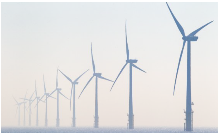
Windturbines in het offshore windpark Egmond aan Zee (OWEZ), het eerste grote windpark dat in de Noordzee voor de Nederlandse kust is gebouwd.

ECONOMIE Gemeentebesturen van Zandvoort, Bloemendaal en Noordwijk krijgen een fonds van 750.000 van Eneco onder voorwaarde dat ze zich 20 jaar lang niet negatief zullen uiten over windenergieparken voor hun kust. Dat staat in een convenant dat ze op 5 juni zullen tekenen met Q10 Offshore Wind bv, meldt NRC Handelsblad .